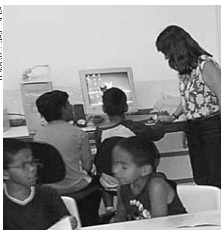
Curso é destinado a professores primários

Na ficha de inscrição, o interessado deverá indicar a cidade pela qual concorre às vagas, já que a classificação será feita